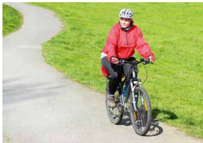
↪ Freude am Fahren: Radfahren macht immer Spaß, unabhängig vom Gewicht.

Shops außerhalb Deutschlands haben ebenfalls große Größen im Programm, wie www.i-ris.cc aus den Niederlanden, oder, mit sehr eindeutigen Markennamen, https://fatladattheback.com aus England.